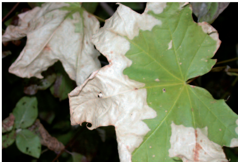
Vertrocknungserscheinungen an heimischem Ahorn als Folge der Dürre im Sommer 2003

ring, manipulativen Experimenten und Modellierungen bzw. Simulationen optimal vernetzt. Die im Verbund erzielten, grundlegenden Forschungsergebnisse bieten Einsatzmöglichkeiten in Wirtschaft und Gesellschaft, beispielsweise für Forst- und Landwirtschaft, Prognose von Naturgefahren, Naturschutz, Raumplanung und Wasserwirtschaft. Damit übernimmt dieses Vorhaben Bayerns eine Vorreiterrolle in der Klimafolgenforschung in Deutschland.