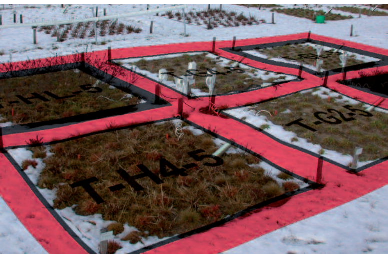
Experimentfläche zu klimatischen Extremereignissen (EVENT-Experiment an der Universität Bayreuth)

und langlebige Modellökosysteme z.B. Wälder, Grünländer, Gewässer!